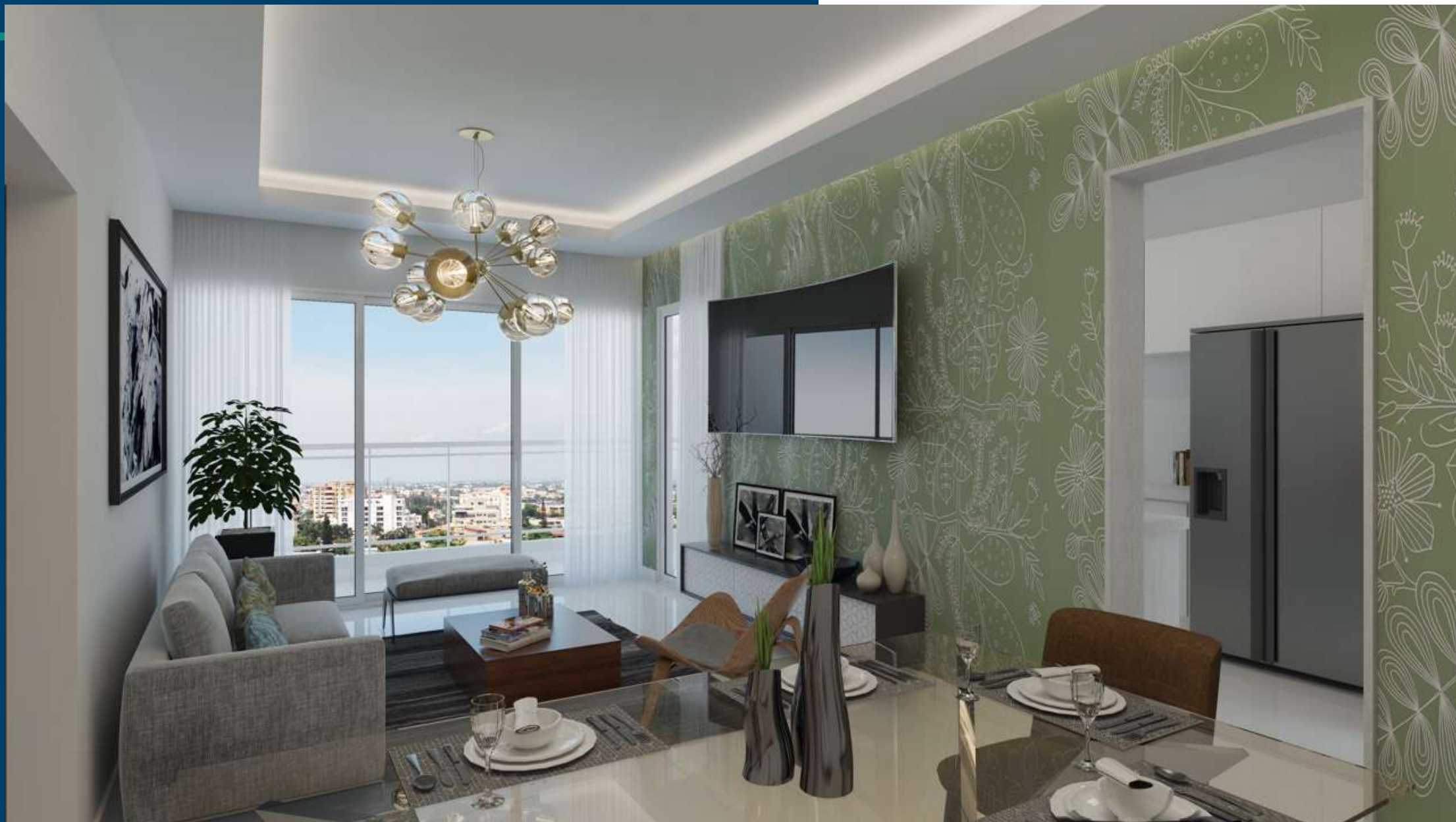
Imagen de referencia, vista conceptual del ambiente, Información sujeta a cambios