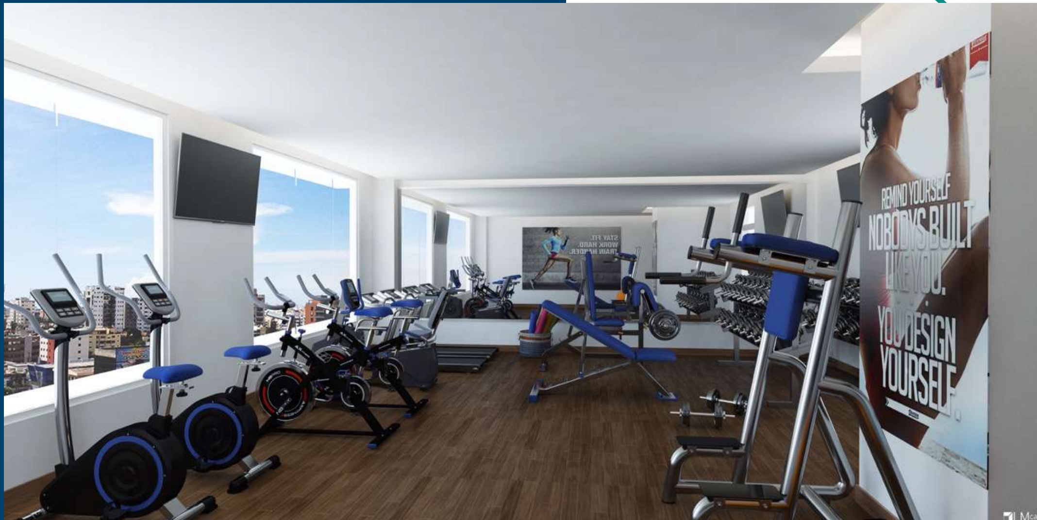
Imagen de referencia, vista conceptual del ambiente, Información sujeta a cambios