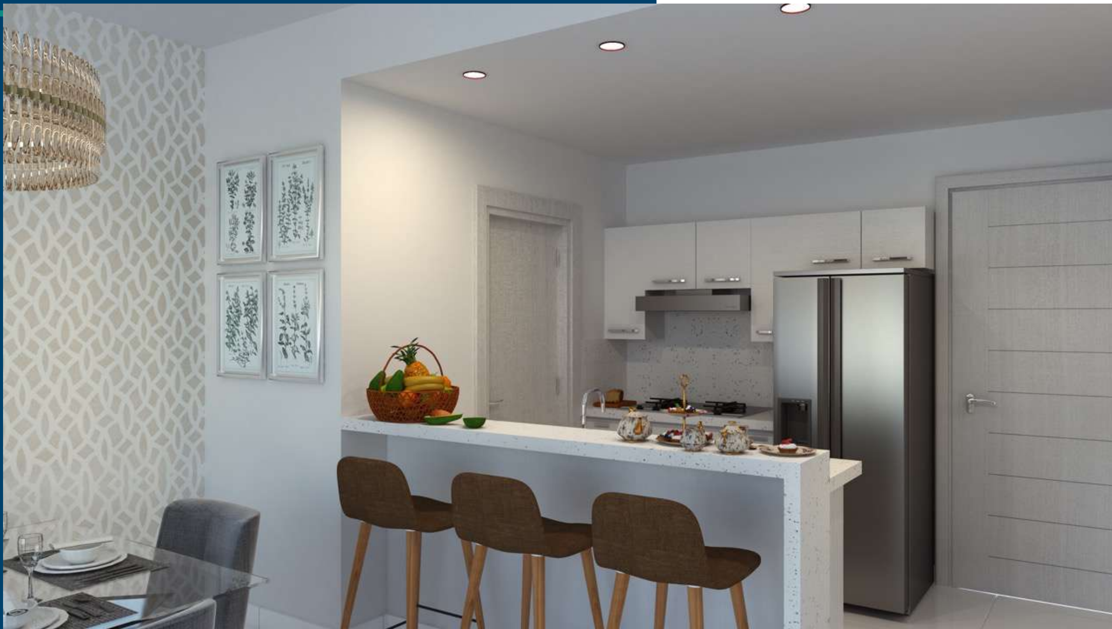
Imagen de referencia, vista conceptual del ambiente, Información sujeta a cambios