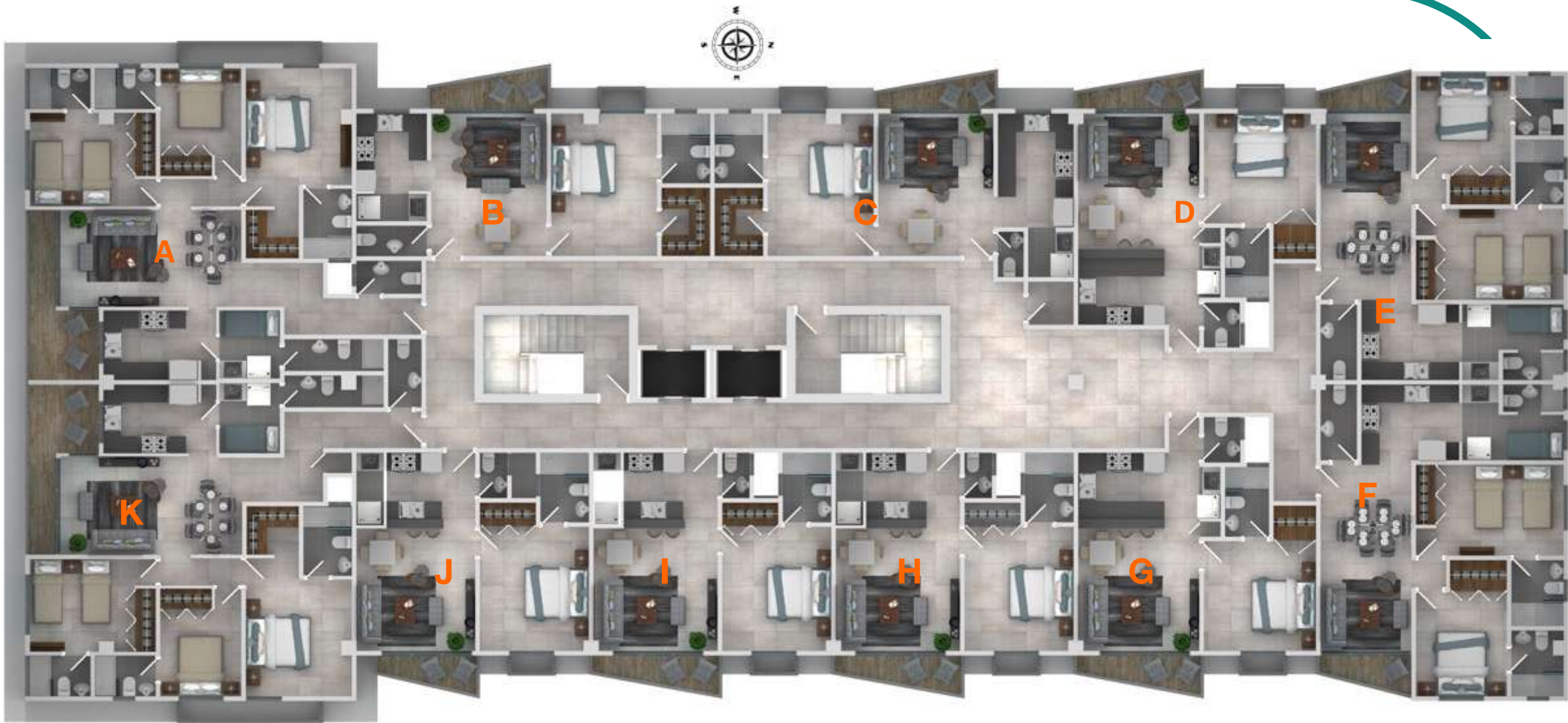
Imagen de referencia, vista conceptual del ambiente, Información sujeta a cambios